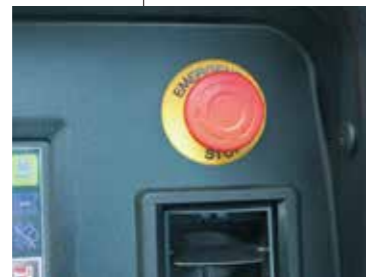
▲エンジン緊急停止ボタン(クレーン作業時のみ機能)