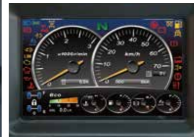
(クレーン操作モード)

※写真は、機能説明のために各ランプを点灯したものです。実際の走行作業状態を示すものではありません。