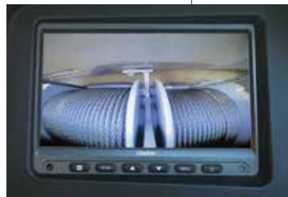
▲カラーディスプレイ(4画面表示可能)

※写真は、機能説明のために各ランプを点灯したものです。実際の走行作業状態を示すものではありません。