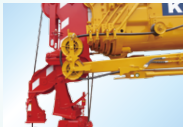
▲ホースセット状態